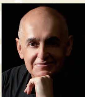
指揮 ジョルト・ナジ Zsolt NAGY

ハンガリー生まれ。ブタペストのリスト音楽院でI.パルカイに指揮を学び、1984年に最優秀栄誉のディプロムを授与される。その後、P.エトヴェシュに学び、カールスルーエ音楽大学における彼のアシスタントとなって以後、国際エトヴェシュ・インスティテュートの客員教授としてヨーロッパ各地で教鞭をとった。1987年以降、オペラ、コンサートの指揮者として活躍しており、1992年からはヨーロッパ、南アメリカやアジアの音楽学校においてさまざまなオーケストラ・プロジェクトや指揮者のマスタークラスの指導を行っている。1999年にはイスラエル・コンテンポラリー・プレイヤーズの主任指揮者兼音楽監督に任命され、また2002年から2014年には、パリ国立高等音楽舞踊院において、指揮科教授として後進の指導にあたった。これまでにBBC交響楽団、RAI国立交響楽団、国立ハンガリー交響楽団、エルサレム交響楽団、フィンランド放送交響楽団、アンサンブル・アンテルコンタンポラン、クランクフォーラム・ウィーン、またドイツ国内においてはベルリン放送交響楽団、シュトゥットガルト放送交響楽団など実に多くのオーケストラやアンサンブルの指揮を務めており、新日本フィルハーモニー交響楽団や藝大フィルハーモニア管弦楽団の指揮者として日本へも何度も招聘されている。また、800を超える初演の功績と、同数におよぶ放送のための録音、CD録音、及び新しいイスラエルの音楽の秀逸な演奏により、特別賞を受賞している。東京藝術大学音楽学部卓越教授。