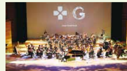
2017.3.29 奏楽堂企画学内公募 藝大ゲームサウンドオーケストラ