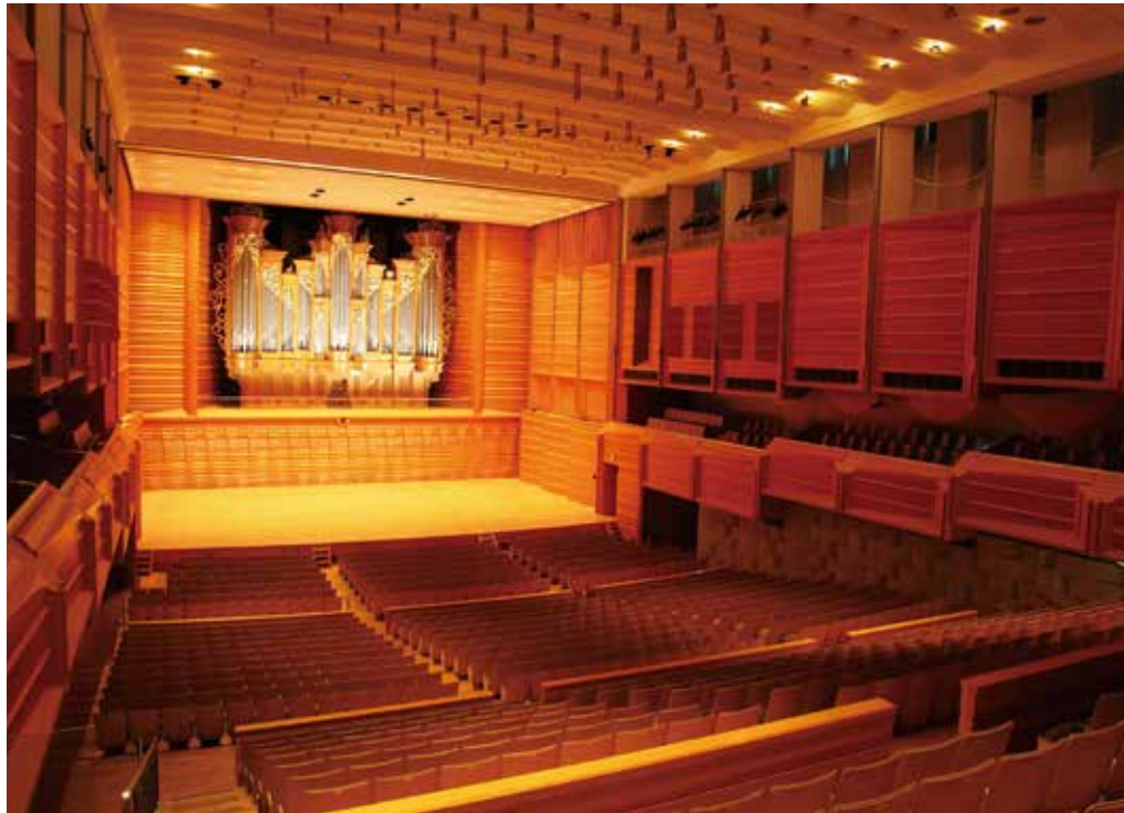
東京藝術大学奏楽堂